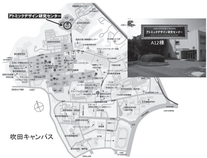
(b) 吹田キャンパス A12 棟