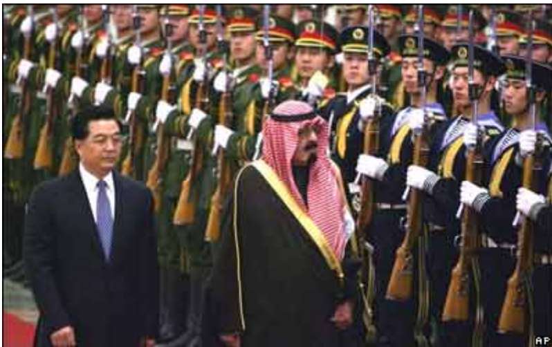
2006年1月 サウジアラビア国王が中国訪問